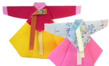
おりがみで韓服 (チマチョゴリ) づくり