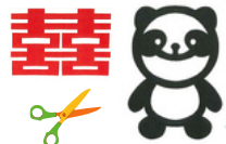
中国の切り絵 & ポップアップ切り絵