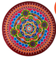
インドの祭り「ディワリ」 ランゴリ袋づくり