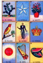
メキシコ版ビンゴ 「ロテリア」